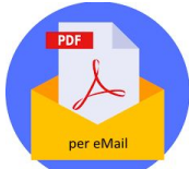
Dokumente per eMailanhang, teilweise gepackt und/oder verschlüsselt