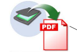
Dokumente als Papier / Scanner